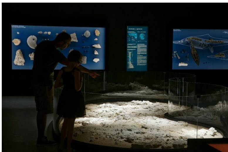
Exposition « Traces du Vivant » Musée de Lodève